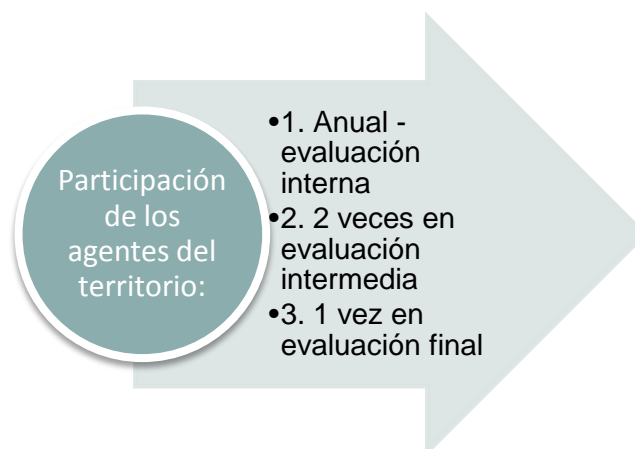
Gráfico nº2: Participación de los agentes en la evaluación de la EDLP